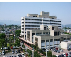
現在の小田原市立病院

小田原市 令和3年度当初予算 一般会計過去最大694億円 コロナ禍の影響で税収大幅減 小田原市の令和3年度当初予算が、小田原市議会3月定例会で可決されました。一般会計は694億円で過去最大規模。歳入は、市税がコロナ禍の影響で前年度比で13億8500万円の大減となり、歳出が、高齢化などを背景に社会保障関連費に充てる扶助費の増加が続くほか、感染症対策や経済対策などの経費の増額も避けられないなど、これまでになく厳しい予算となりました。