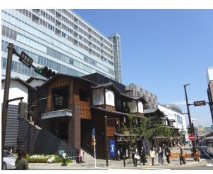
「イノベーションラボ」が開設されるミナカ小田原